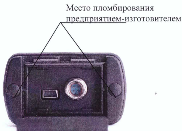
Рисунок 2 – Схема пломбировки от несанкционированного доступа